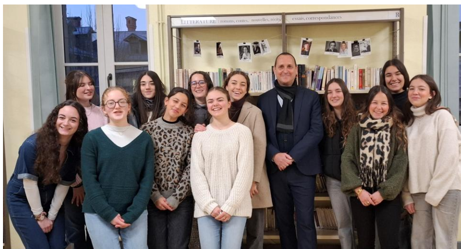
Accueil des élèves correspondantes espagnoles dans le cadre du dispositif de mobilité étudiante Picasso Mob, le lundi 13 janvier 2025, CDI du LED